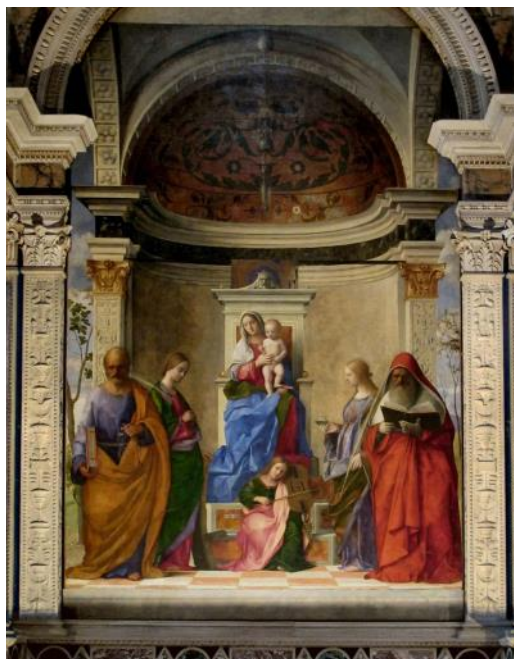
Giovanni Bellini, Vierge à l'Enfant entourée de saints , église San Zaccaria, Venise, 1505

turelle de l'Homme-Dieu, mais elle est aussi spirituellement son épouse, sa compagne, son aide dans l'œuvre de notre rachat. Marie a coopéré activement à toute la vie de Jésus. Ce sont Jésus et Marie ensemble qui nous font enfants de Dieu. Par conséquent, si Dieu est notre